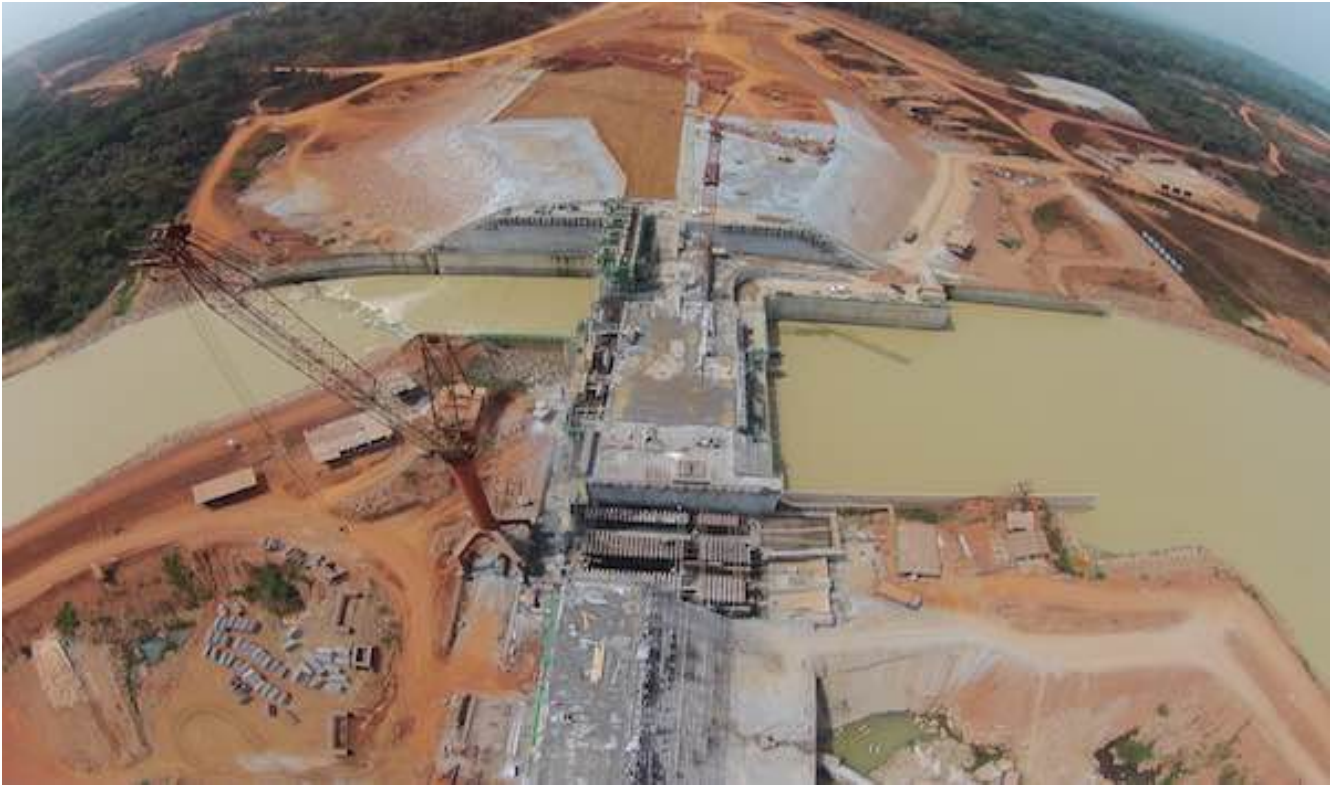
Le barrage de Lom Pangar. Le « développement durable »...