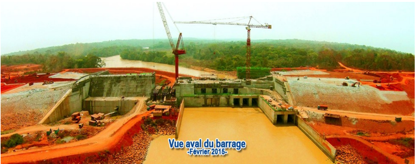
Une autre vue.